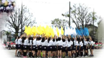
二和っ子サポーターズ