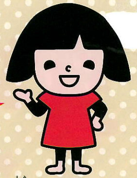
笑味ちゃん

JAグループがすすめる「みんなのよい食プロジェクト」の一環として、これからの食・農を担う次世代の子どもたちに、お米・ごはん食、稲作など、日本の食卓と国土を豊かに作りあげてきた稲作農業全般についての学びを深めてもらうとともに、子どもたちの優れた作品を顕彰することをつうじて、稲作農業の多面的機能と、お米・ごはん食の重要性を広く周知するために開催しています。