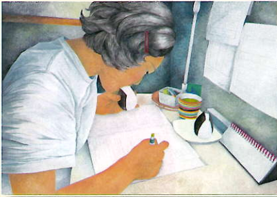
「おむすびは勉強のおとも」