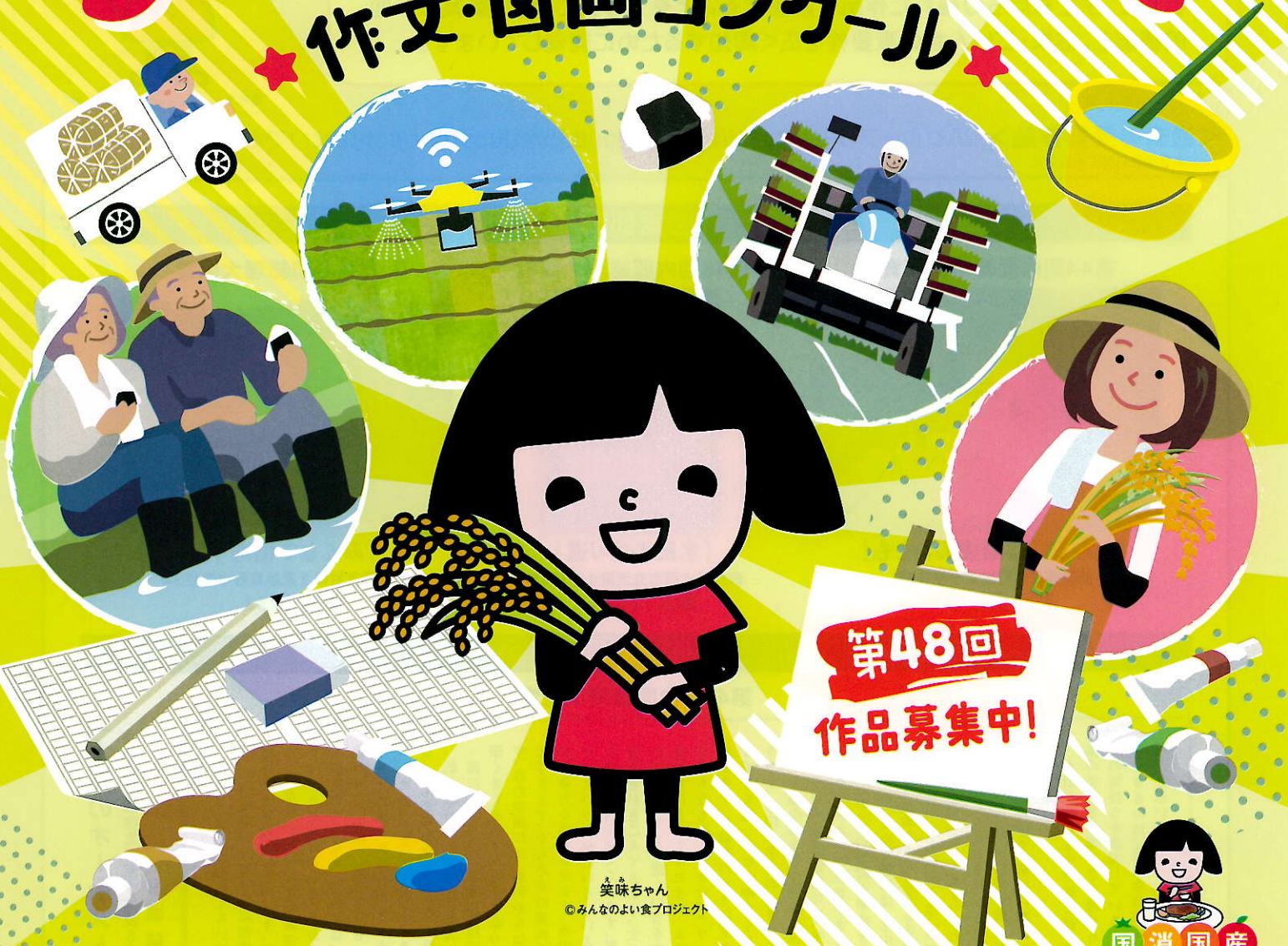
笑味ちゃん