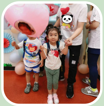
朝9時と午後3時半、送り迎え

中国のカレンダーについて、 ①曜日を「日一ニ三四五六」で表します。 例：月曜日→星期一 ②数字日付の下に、漢数字で旧暦や節分などを書きます。 例：7月20日＝旧暦の六月三日