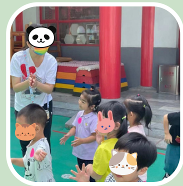
体操など室外の活動をしています