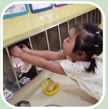
ハンカチを自分のコーナーに戻します