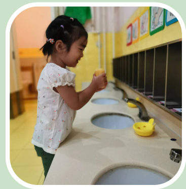
ソープでしっかりと手を洗います