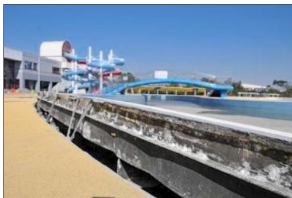
▲ ふなばし三番瀬海浜公園(液状化による被害)

また、鉄道機関が運休したことにより、船橋駅、西船橋駅を中心に帰宅困難者が大量に発生した。市は発災当日深夜には57の施設を避難所として開設し、5,480人の避難者・