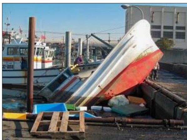
▲ 船橋漁港(津波による被害)

この地震により発生した津波は、岩手県大船渡市で高さが16.7mに達し、最大遡上高は40mを超えた。千葉県においても、銚子市で2.5m、館山市で1.7m、湾内の千葉市でも0.9mの高さを記録したほか、本市でも2mを超える津波の影響で、海苔の養殖設備が壊滅的な被害を受けたほか、船橋漁港内の船が転覆するなどの被害が発生した。