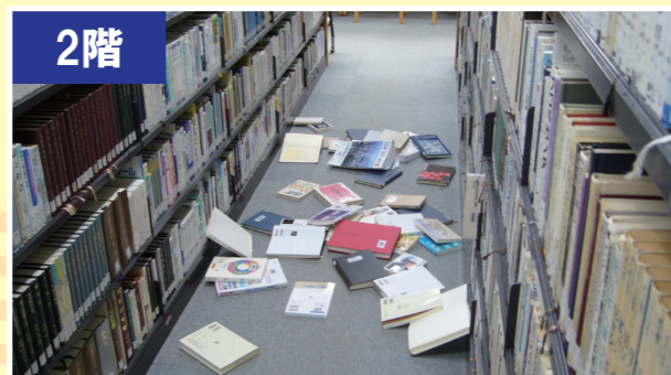
2011年東北地方太平洋沖地震のときの 東京都内のビルの室内の様子