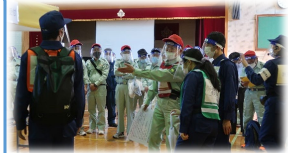
避難者受付時の感染症対策

訓練概要 ：座学:新型コロナウイルス感染症対策での避難所運営のポイント 避難所開設・運営訓練 ①避難者受付時の感染症対策 ②一般避難者用エリア受付要領と区画割り ③発熱者等専用エリア受付要領と区画割り