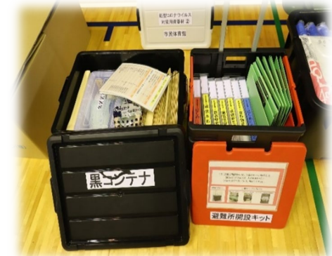
避難所開設キット

訓練概要 ：避難所開設キット（感染症対策を含む）を使用した避難所開設訓練、I P 無線・ドローン等を使用した本部との連携訓練 要配慮者の移送（スクリーニング）訓練 外国人対応訓練（通訳翻訳ボランティア訓練）