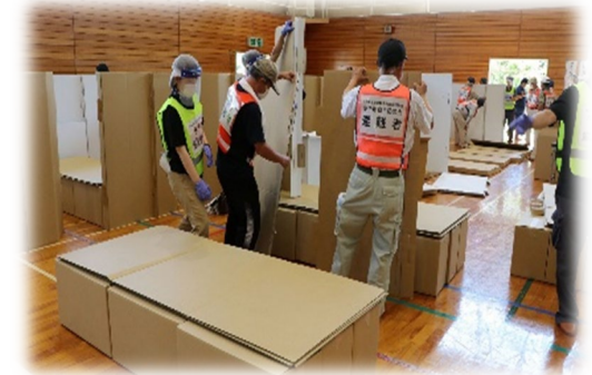
自主防災会による段ボールパーティション作成

訓練概要： 避難所開設訓練・避難者受付訓練・保健師による問診 避難所生活環境作成訓練 （段ボールパーティション・室内用テント） 避難生活におけるペットの取り扱い説明