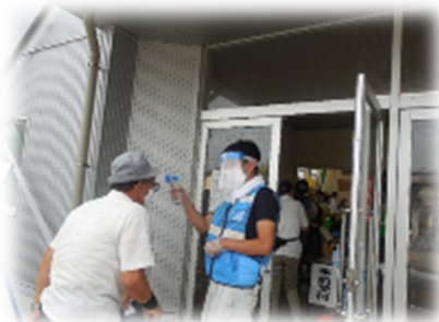
避難所での検温の様子