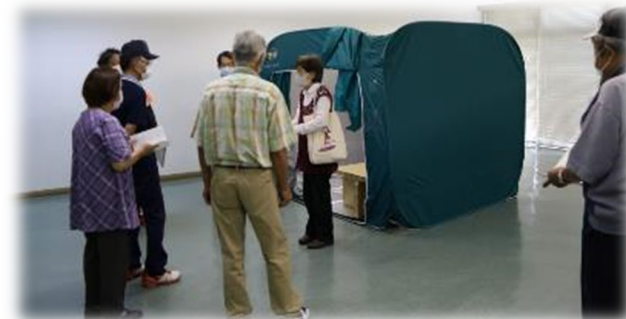
避難者（住民）受入れ