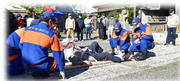
消防団員による負傷者運び出しの様子