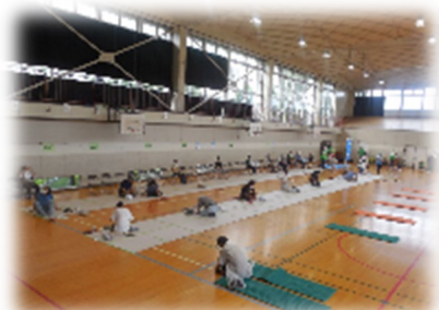
避難所レイアウト