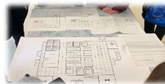
レイアウト検討 避難所