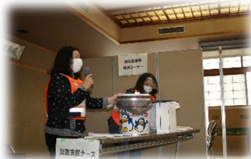
防災士による講義