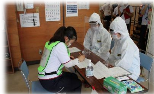
発熱者等専用避難所