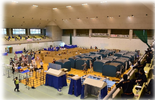
避難所運営訓練の様子