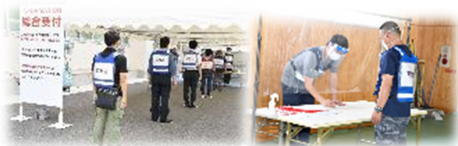
受付(県シミュレーション)