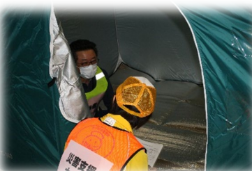
災害支援ナースの巡回