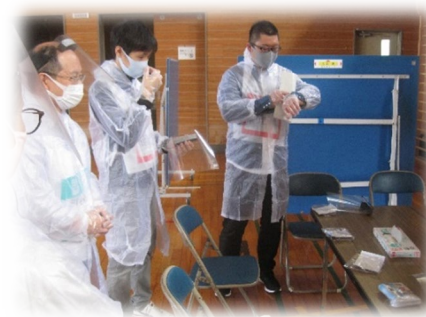
個人用防護具装着の様子

訓練概要 ：避難所レイアウト作成訓練 避難者受付・誘導訓練 個人用防護具装着訓練など