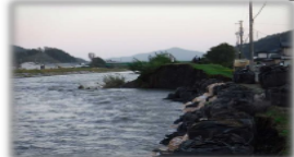
台風19号大槌川（大ヶロ）