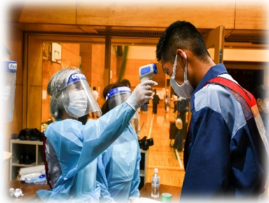
避難所受付の様子