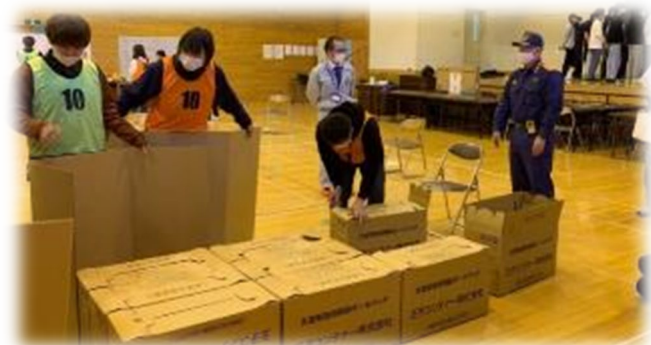
学生による避難所運営訓練