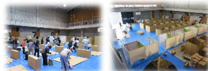
避難所運営・体験訓練の様子