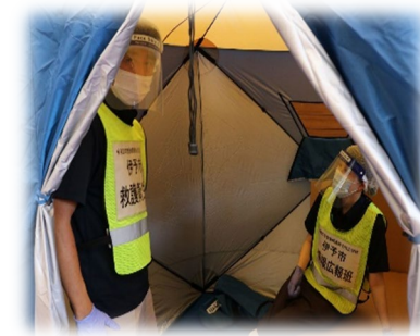
要配慮者用室内テント