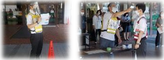
避難所受付の様子