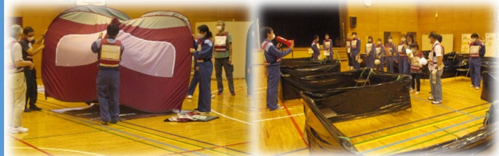
パーティション設置

訓練概要 ：訓練参加者健康状態確認訓練、避難者受付割振訓練 資機材設置・避難所環境整備訓練、防護服等着用訓練