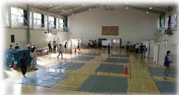
避難者スペース配置状況