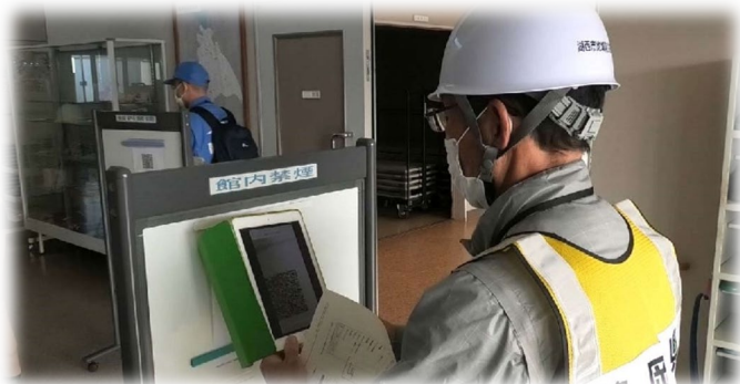
QRコードを読み込みチェックイン