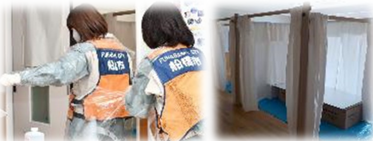
体調不良者の対応準備