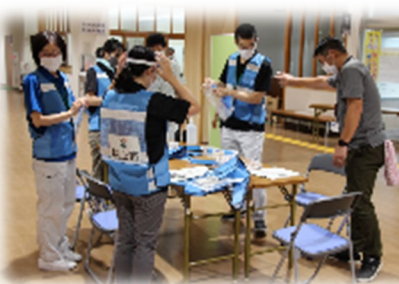
フェイスシールド着用の様子