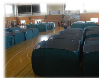
パーティション等設置

訓練概要： 事前受付（問診票、体温計測）、専用スペース設置、簡易テントによるパーティション設置