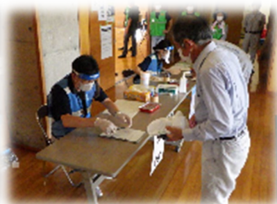
避難所受付の様子