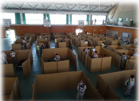
パーティション設置の様子