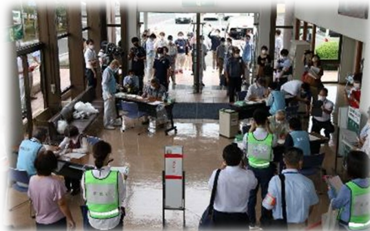
一般避難所の様子