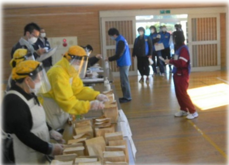
受付・物資提供訓練の様子