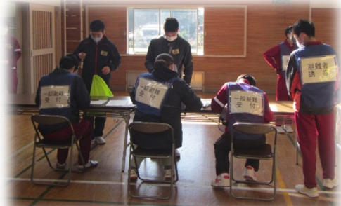
受付・滞在場所指定訓練の様子