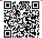
防災啓発動画