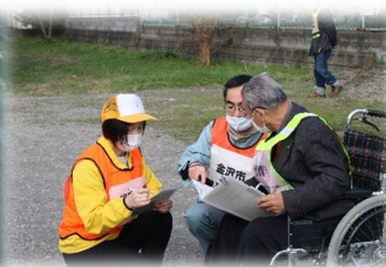
避難者のトリアージ