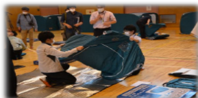
避難所運営職員研修会