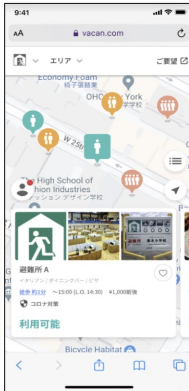
混雑状況システム