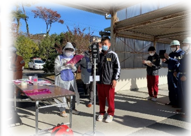
体温測定、問診の様子