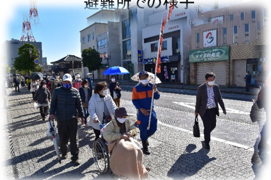
町内会等による避難所への誘導の様子