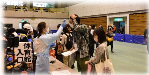
検温・問診の様子