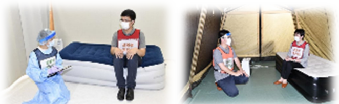
体調不良者専用スペース(県シミュレーション)