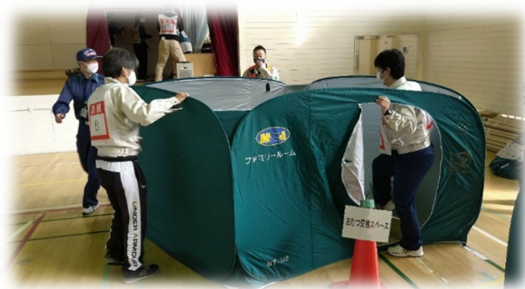
パーティション設置の様子