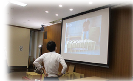
資機材組立動画の視聴

訓練概要 ：避難所用屋内型テント、段ボールベッド等の資機材の展示・組立デモンストレーション、個人用防護具の着装