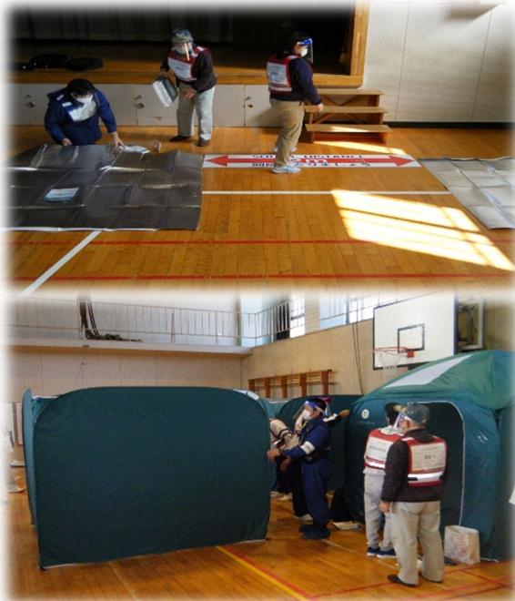
一般避難者用エリア区画割り