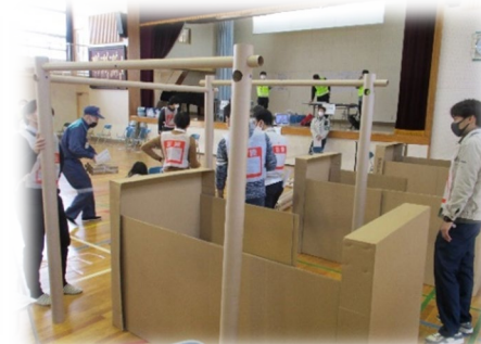
間仕切り設置の様子