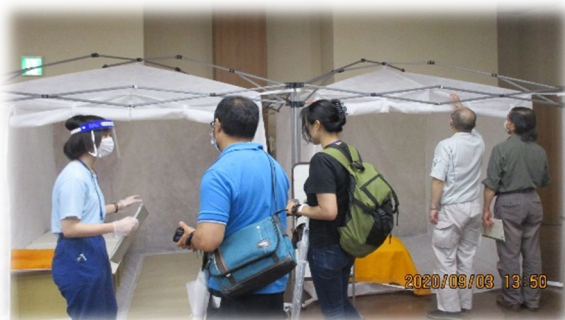
避難所用屋内型テントの説明