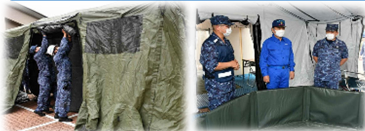
自衛隊による仮設入浴施設展示説明