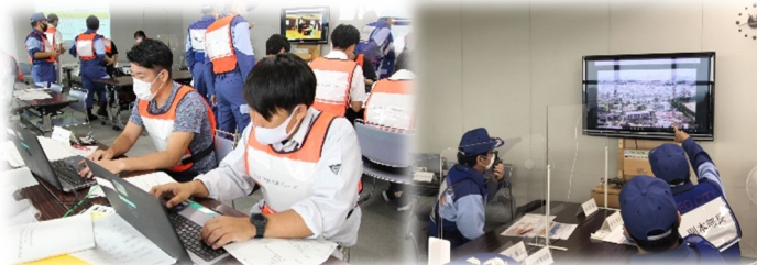
本部運営状況及びドローンのリアルタイム映像