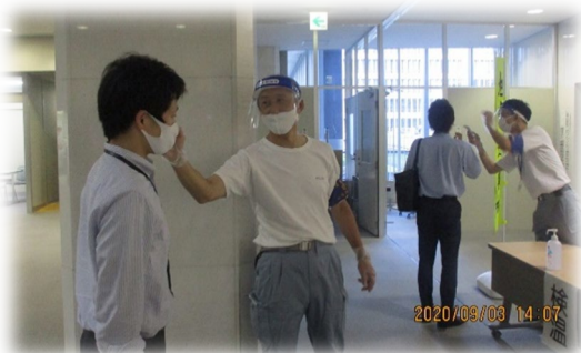
避難者受付の様子