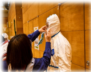
防護服等着用の様子