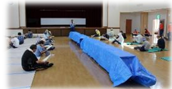
感染症対策に関する説明

訓練概要 ：自治会単位での避難訓練、避難所開設・運営訓練（コロナ対応の検証）災害対策本部と避難所間でのZOOM交信訓練