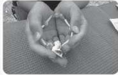
三番瀬の貝殻で工作体験