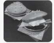
アイスもなか (2個分)