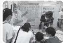
昨年のパネル展示