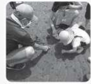
昨年の観察ワークショップ