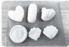
無添加こねこねせっけん