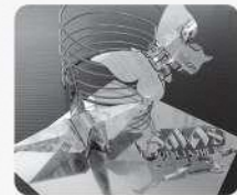
アルミ缶を再利用!

★のワークショップは学習館ホームページ、●のワークショップは市ホームページよりお申し 込みください (表面二次元コード参照)。■のワークショップは当日受付です。