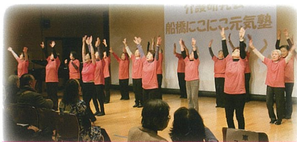
ステージパフォーマンス プログラムはこちら→