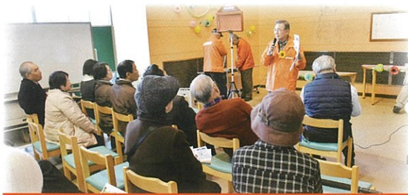
お楽しみ活動実演体験 プログラムはこちら→