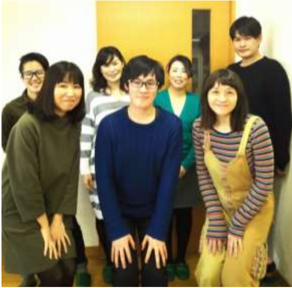
JASHメンバーの皆さん