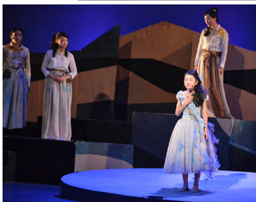
▲出演者の熱演でアンデルセン童話の世界を表現