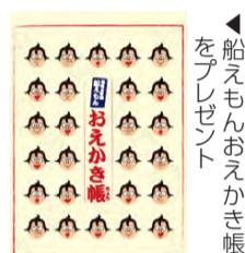
▲船えもんおえかき帳をプレゼント

船橋ならではの産品をブランド化する「ふなばしセレクション」。工業・工芸品の1次審査を通過した製品の展示と2次審査のためのアンケートを実施します。アンケート回答者には各日先着250人に「船えもんおえかき帳」をプレゼント。船橋の「ええもん」発掘にご協力ください。