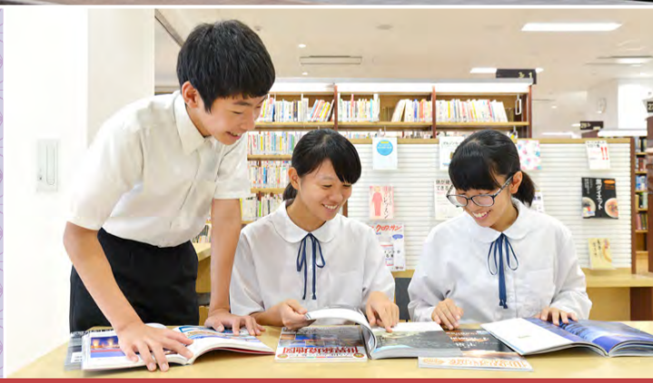
▲本と親しめる約240席の閲覧席