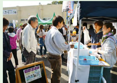
ふなばしセレクション認証品を販売します!

〈日時〉10月22日(土)午前9時～11時 〈会場〉農産物直売所ふなっこ畑(行田3) 〈販売品目〉○小松菜などの野菜類 ○スズキ・ホンビノス貝などの魚介類 ○和菓子・佃煮などの加工品 ○船橋産の野菜を使ったピザ・焼きそば ほか