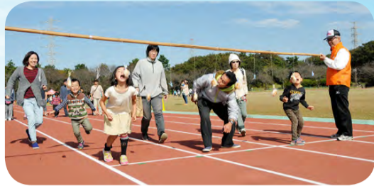
▲家族で参加できるパン食い競争

〈日時〉11月6日(日)午前10時～午後3時※当日自由参加。入場無料。雨天の場合、屋外イベントは中止 〈会場〉運動公園※来場の際には公共交通機関をご利用ください