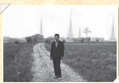
▲昭和36年頃の行田。一面畑の中に無線塔が立ち並びます

写真は昭和36年に撮影しました。このときはまだ当たり前のようにそびえ立っていた無線塔がこの10年後に解体されたときは、戦後25年以上経っていてもかかわらず「日本は負けたんだな」とあらためて寂しく感じたと覚えています。