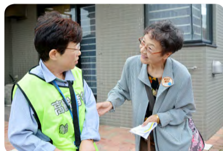
徘徊高齢者役(左)に優しく声をかけます

会場へお越しください。 会場・日時 ※当日自由参加 ○南部圏域(メイン会場) JR船橋駅北口おまつり広場 / 12月3日(土)午前10時~午後0時30分 ○北部圏域 JR松が丘公民館 / 10月28日(金)午前9時30分~正午 ○東部圏域 JR海松台公民館(前原東5) / 11月2