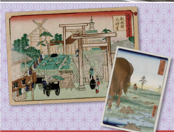
▲浮世絵や古文書など貴重な資料を所蔵