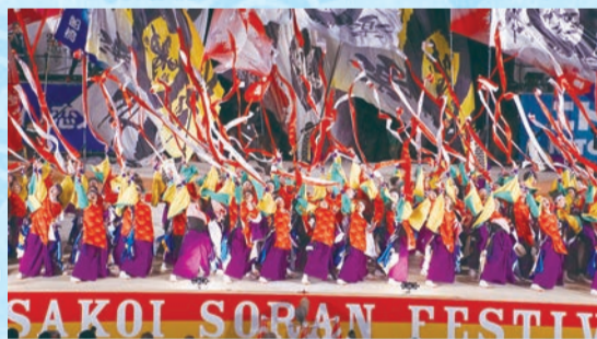
▲華やかな演舞で観客を魅了した「REDA舞神楽」

6月8日～12日に札幌市で行われた国内最大級のよさこいイベント「第25回YOSAKOIソーラン祭り」で、船橋市を拠点に活動するよさこいチーム「REDA舞神楽」が約280チーム中2位に相当する準大賞(札幌市長賞)を受賞