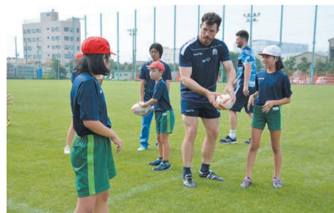
▲パスの仕方を実際に見せながら指導するティム・スウィンソン選手

クリニックでは、選手が毎日欠かさず行うという基本のパス練習や、ラグビーボールを使った簡単なゲームを実施し、選手たちは子どもたち一人ひとりに「very good!」と優しく声をかけていました。選手が約70メートルもの遠投をやってみせると、子どもたちは「すごい!」と歓声をあげ拍手喝采。世界トップクラスの選手との交流に、終始笑顔と歓声があふれていました。