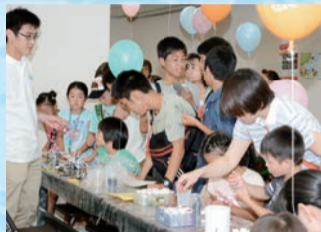
▲オリジナルの七宝焼きを作成中