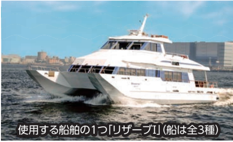
使用する船舶の1つ「リザーブ」(船は全3種)