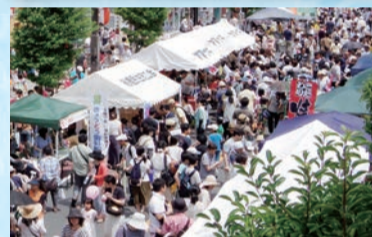
▲フリーマーケットは毎年大勢の人でにぎわいます