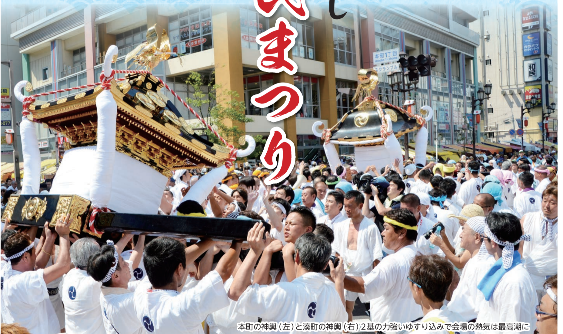
本町の神輿(左)と湊町の神輿(右)2基の力強いゆすり込みで会場の熱気は最高潮に