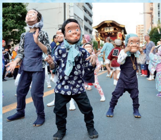
▲13台の山車がくり出すばか面パレードなど見所がたくさん