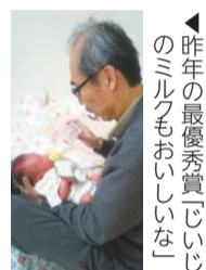
「昨年の最優秀賞(じいじのミルクもおいしい)」

「男女共同参画社会写真コンクール」作品募集 テーマ「性別に関係なく家庭や地域で協力し合う様子」/市内在住・在勤・在学の人/8月31日(水)(必着)まで