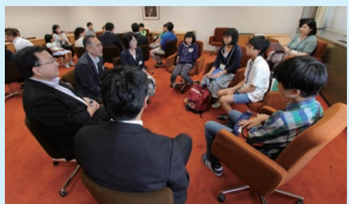
▲リラックスして議員さんと話すことができました

〈日時〉8月17日(水)、18日(木)○小・中学生⇨各午前10時～正午 ○高校生⇨各午後1時～3時 〈場所〉船橋市議会(市役所10階) 〈対象〉市内在住、在学の小学3年生～高校生※小学3・4年生は保護者同伴 〈定員〉各回先着50人 〈申込み〉参加希望日・参加者全員(保護者含む)の氏名・学校名・学年・日中の連絡先を議会事務局庶務課(☎436-3012 FAX 436-3013 Eメール gikai-chosa@city.funabashi.lg.jp)へ