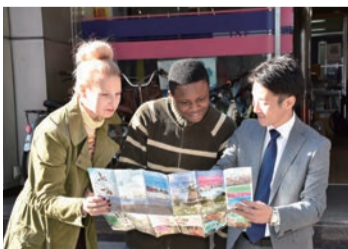
▲リーフレットを通じて会話がはずむと大好評。これであなとも市民観光大使！

〈配布場所〉船橋駅前総合窓口センター(フェイスビル5階)、葛南地域振興事務所(同ビル7階、パスポート受取窓口)、各出張所、市役所(広報課、国際交流室)、インフォメーションセンター(JR船橋駅南口)など※ご希望の部数をお渡しできます。まとまった部数が必要な場合は事前に広報課へご連絡ください