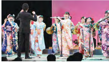
▲華やかな晴れ着で新成人が演奏を披露

FAX 436-2893 Eメール shakaikyoikuka@city.funabashi.lg.jp