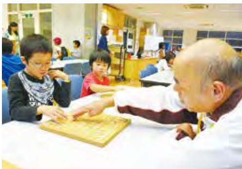
▲地域のボランティアと将棋を通じて交流(西海神小)

活動場所(視聴覚室等の特別教室や校庭、体育館など)でスタッフが見守る中、友達と遊んだり、読書をしたり、ドリルをしたり、地域のボランティアによる卓球や工作教室などに参加したりすることもできます。畑で作物を育てたり、読み聞かせや手品などのイベントを行ったりする教室もあります。