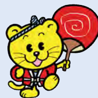
千葉県明るい選挙 シンボルキャラクター 「せんきょくん」