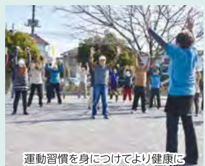
運動習慣を身につけてより健康に