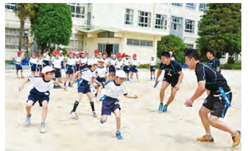
▲腰につけたタグを取られないように、選手を避けて走ります(中野木小)

※タグラグビー…ルールはラグビーとほぼ同じ。子どもでも楽しめるようタックルなどの接触プレーをなくし、腰につけたタグを奪って相手の攻撃を阻止する