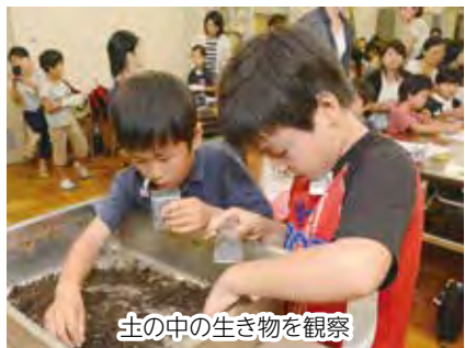
土の中の生き物を観察

日内対費下表 会場 市立船橋高校 定員 各先着40人※29日午後は30人、30日は各20人 申込み 7月8日(金)までに、同校ホームページから申し込み 問合せ 同校 ☎422-5516