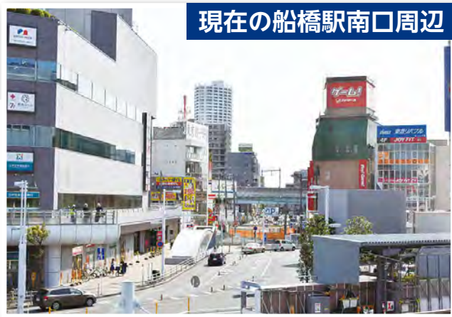
現在の船橋駅南口周辺