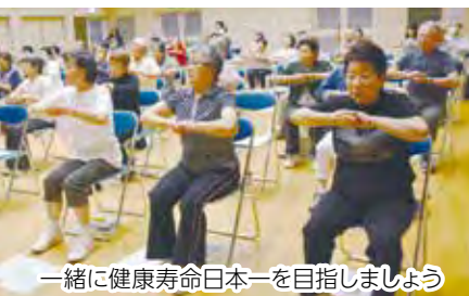
一緒に健康寿命日本を目指しましょう

▶指導士養成講習会 体操の実技や身体に関する知識を学ぶ講習会です。講習修了後、市民に体操を教える「体操指導士」に認定されます。