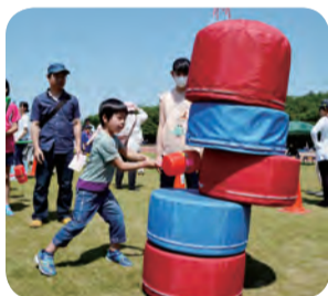
▲大迫力のだるま落とし

〈日時〉5月8日(日)午前9時30分～午後2時※当日自由参加。雨天の場合、体育館のみ実施 〈会場〉運動公園※来場の際は公共交通機関をご利用ください 〈内容〉模擬店、おぼけやしき、ダンスや吹奏楽の演奏、動物ふれあいコーナーなど ▶野球体験教室 当日午前10時30分～野球場で受付/先着20人/小学1～4年生/無料