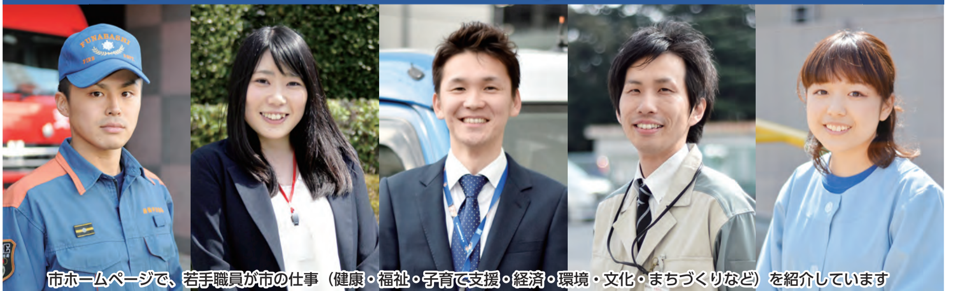
市ホームページで、若手職員が市の仕事（健康・福祉・子育て支援・経済・環境・文化・まちづくりなど）を紹介しています