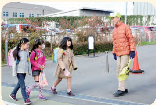
▶子どもたちの通学を温かく見守ります

市では、不審者被害から子どもを守るために、登下校の時間に合わせて、通学路や学区の公園を中心にパトロールを行い、子どもたちを見守る「スクールガード活動」を推進しています。