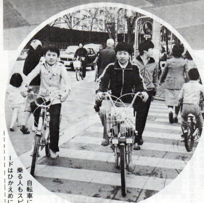
自転車に乗る人もスピードはひかえめに