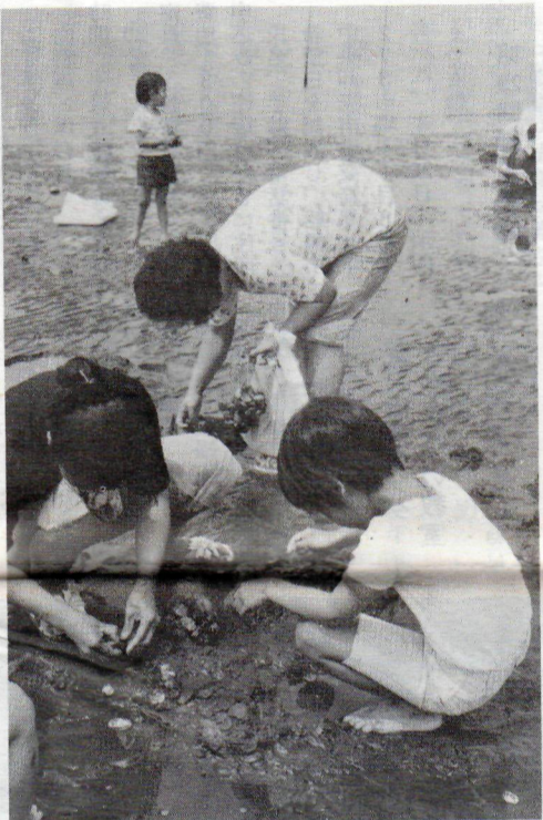
昨年は延べ1900人の人出でにぎわいました。(市営潮干狩り場)