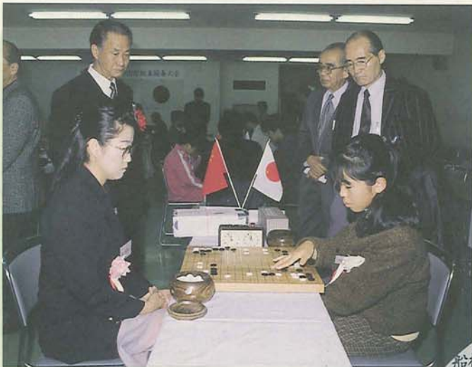
船橋市・西安市国際親善囲碁大会