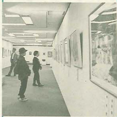
第37回船橋市市展 (市民ギャラリーで)