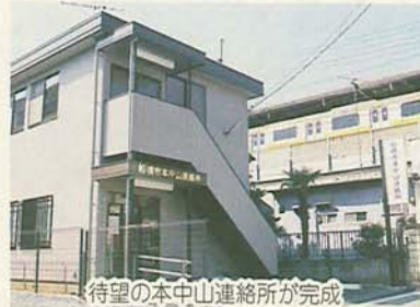
待望の本中山連絡所が完成

JR船橋駅南口から国道14号線までの約740メートルを違法駐車等防止重点地域に指定。市・事業者・市民の三者が力を合わせて、違法駐車や迷惑駐車を追放していきます。(6月15日号)