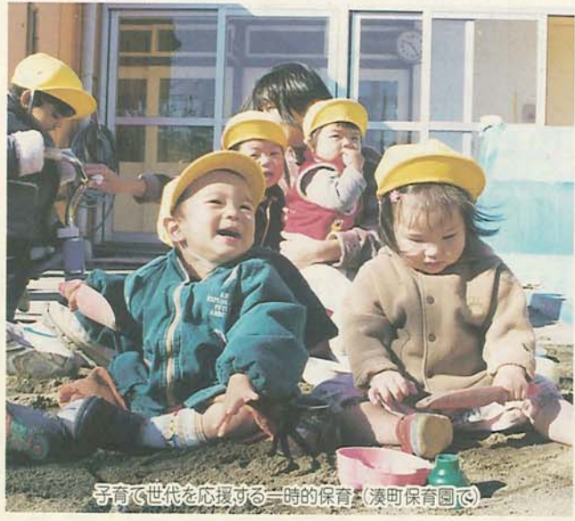
子育て世代を応援する一時的保育(湊町保育園)