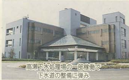
高瀬下水処理場の一部稼働で下水道の整備に弾み

高瀬下水処理場が4月1日から始動。1日あたり2万5250立方メートル、約3万人分の汚水を処理しています。これにともない市の下水道普及率が約39パーセントとなりました。(4月15日号)