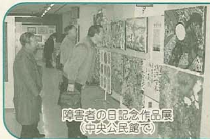
被害者の日記念作品展 (中央公民館で)

水12日(水)に、所定の申込書(四市複合事務組合事務局で配布中)を同事務局(市福祉ビル5階)へ436・2772へ