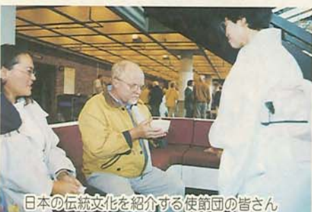
日本の伝統文化を紹介する使節団の皆さん

デンマーク王国・オーダーデンセ市との姉妹都市提携10周年を記念して8月19日から24日まで文化親善使節団がオーダーデンセ市を訪問、文化交流会や合同合唱コンサートなどを開きました。両市の市民は、今後も草の根の交流を続けていくことを約束しました。(9月15日号)