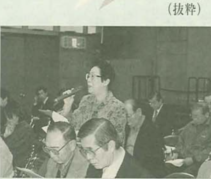
市民の声を聞く課 436-2784