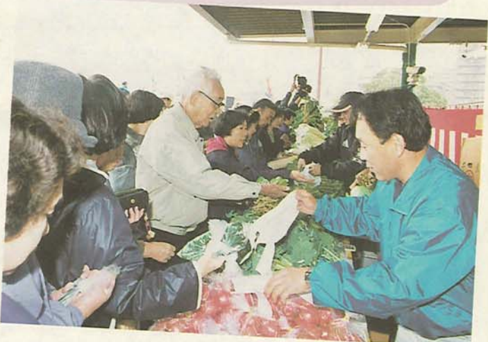
農水産祭の直売コーナーは大盛況

32年ぶりの栄冠 に輝く。第52回県民体育大会で船橋市が総合優勝を果たしました。本市の総合優勝は昭和42年以来的のことです。昨年12月から今年の9月にかけて、県内11市町の会場などで39種目の競技が行われ、競技別では、山岳でアベック優勝をしたのを始め、水泳(女子)、体操(女子)、柔道(男子)、ラグビー、銃剣道、ゴルフを制するなど、圧倒的な強さを発揮しました。