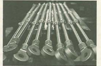
架線の張りを調節する部品ワイヤーターンバックル

鉄道の線路の上を走っている電線を架線と呼ぶ。発電所から送られてきた電気が架線を伝って電車の屋根に付いているパンタグラフを通して、モーターに届く。今回は、架線やそれに付随する金具、鉄柱等を製造している電鉄工業株式会社の工場を訪ねた。