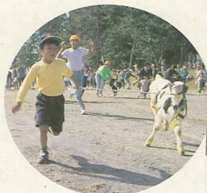
子牛と散歩ゲーム (畜産フェスティバルで)

ケナフの刈り取り が、10月30日に高根町の休耕田で行われました。非木材紙原料のケナフは、他の植物の3～5倍の二酸化炭素を吸収する、環境にやさしい植物です。5月に種をまいたケナフは3メートル以上に成長。高根、夏見台、八栄の小学生たちが、4～5人で力を合わせながら、次々とケナフを引き抜いていきました。体験学習では、この後刈り取ったケナフをすいて、紙を作ります。