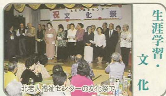
北老人福祉センターの文化祭で