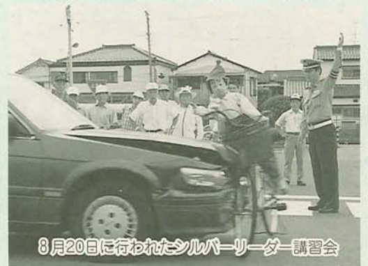
8月20日に行われたシルバーリーダー講習会