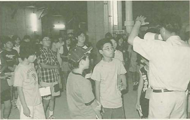
高瀬下水処理場の地下室

8月25日、子ども記者65人が市内の公共施設(高瀬下水処理場、船橋警察署、船橋防災センター)を見学しました。ふだんあまり行くことがない施設を訪れた子どもたちの感想をお届けします。