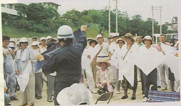
三角巾一枚で止血やねんど、骨折などの応急手当ができます(高根東小学校で)

避難はあわてず 冷静に。8月29日に行われた総合防災訓練に183町会・自治会から7526人、個人参加の1449人、防災関係機関、市職員など1215人の合わせて1万190人が参加しました。今回は、市民の皆さんに災害時に一番大切な避難を体験してもらおうと、市立小学校55校に避難場所を開設。地震発生の際にサイレンを合図に最寄りの小学校に避難した皆さんは、町会や自治会が計画した初期消火訓練や三角巾による応急手当訓練などを行いました。