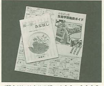
〈問合せ〉社会教育課 ☎436-2897

みなさんの生涯学習を応援するガイドブックを作りました。いよいよ利用された。『楽しく学ぼうふなばし』 今月から12年3月までに、