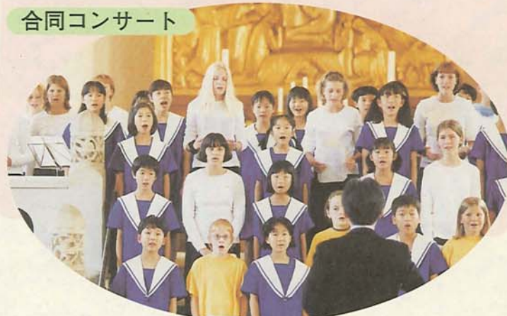
カール・ニールセン作曲の国民的愛唱歌「ひばりの巣」をデンマーク語で合唱。会場から拍手が鳴りやみませんでした