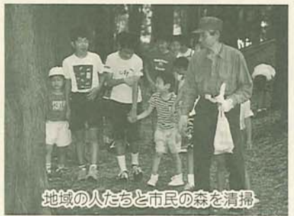
地域のみなさんと市民の森を清掃

学校のとなりに「市民の森」があります。ここにはフクロウやキツツキなどいろいろな鳥がいます。