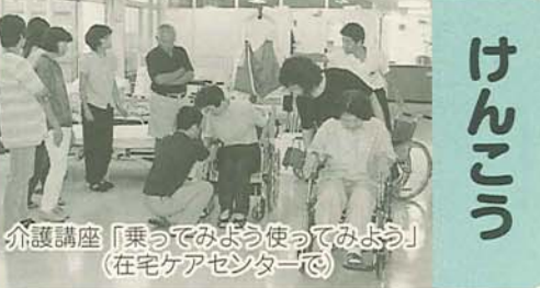
介護講座「乗ってみよう使ってみよう」(在宅ケアセンターで)