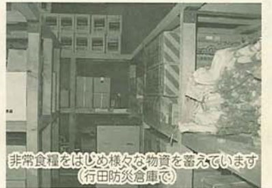
非常食糧をはじめ様々な物資を蓄えています(行田防災倉庫)