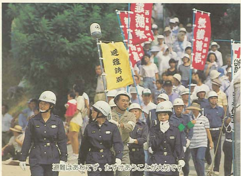
避難はあわてず、たすけあうことが大切です