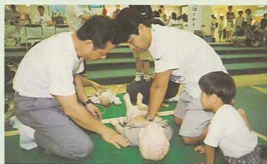
いざという時に役立ちます