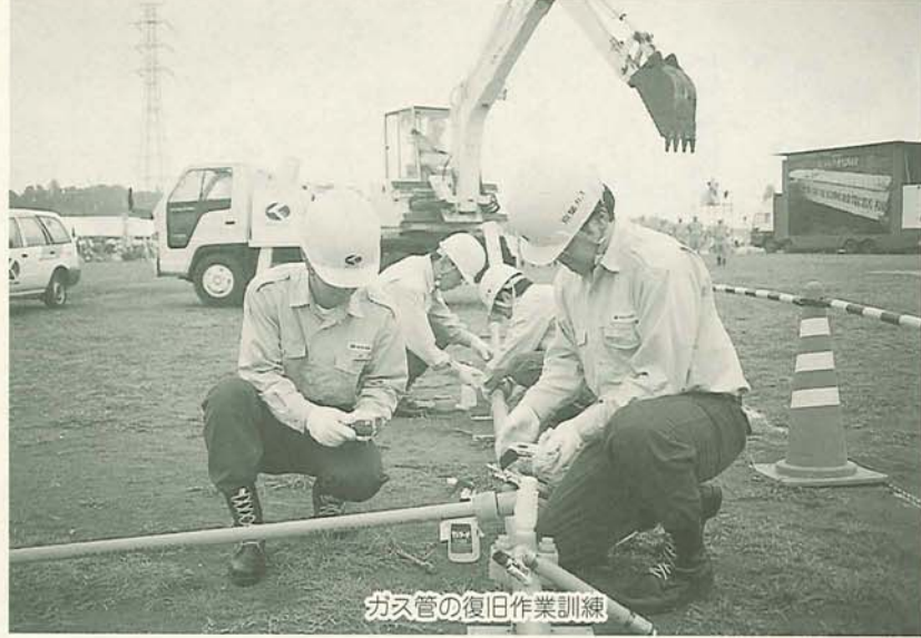
ガス管の復旧作業訓練

A 消火活動用として、現在市内に952基の防火水槽のほか、100トンの耐震性貯水槽を27基設置しています。