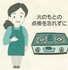
火のもとの点検を忘れず