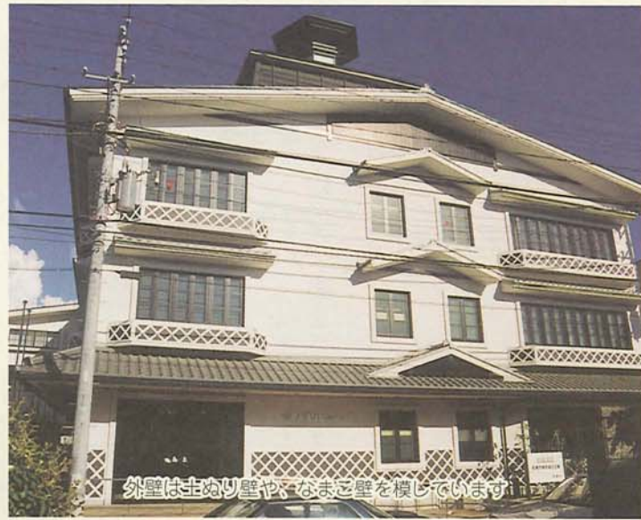
外壁は主ぬり壁や、なまこ壁を模しています

市南部地域の高齢者福祉サービスの新たな拠点として平成9年から建設を進めてきた南部福祉会館がこのほど完成しました。9月1日(水)にオープンする同会館は、南老人福祉センターと南老人デイサービスセンターの複合施設となっています。