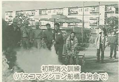
初期消火訓練(バスコモンション船橋自治会)

阪神・淡路大震災で、災害に対する備えの大切さを改めて思い知らされました。それとともに学んだのは人々の連帯と協力がまちを救う原動力となること。「自主防災組織」は、家族や隣り近所がお互い協力し合い、初期消火や救護活動を行うための組織です。被災地救援の大きな力となる自主防災組織の結成にご協力ください。