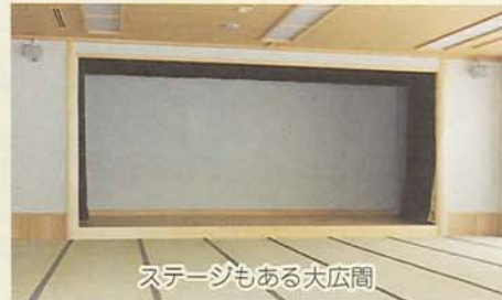
ステージもある大広間

ターは、市の老人福祉センター整備計画の最後の施設です。同センターには、大広間、陶芸室がある作業所、和室、浴室や機能回復訓練室などがあり、60歳以上の人ならなたでも利用できます。健康や生活についての相談を受けるほか、教養講座、レクリエーションなどのイベントも開催する予定です。利用時間などは左表のとおりです。