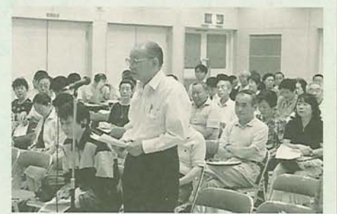
市民の声を聞く課 ☎436-2784