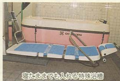
寝たままでも入れる特殊浴槽

寝たままでも入れる特殊浴槽やリハビリテーションを行う日常動作訓練室などがあり、一日に15人程度を受け入れることができます。リフトバスによる送迎も行います。利用申請など詳しくは高齢者福祉課 ☎436・2352までお問い合わせください。