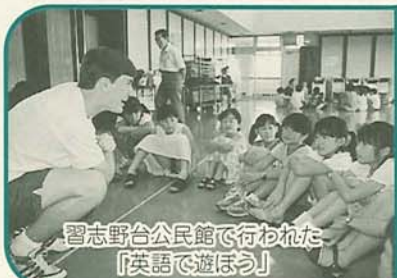
習志野台公民館で行われた「英語で遊ぼう」