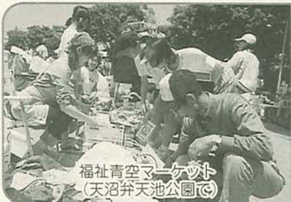
福祉青空マーケット (天沼弁天池公園内)