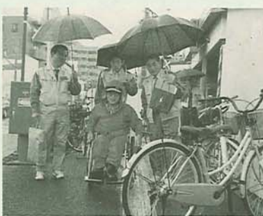
昨年の交通安全総点検で

身近な交通安全対策を考えるため、市民の皆さんとともに道路施設の総点検を行います。 〔日程・点検地区〕 ○7月3日(土)西船地区 (JR西船橋駅前広場から葛飾小方面、同駅周辺の国道14号線) ○7月4日(日)前原地区 (新原成線前原駅前通りから二宮小方面、同葉内台駅前通りから飯山満小方面) 〔時間〕午前9時~午後1時 〔定員〕各先着10人 〔申込み〕6月25日(金)までに電話で道路建設課☎436・2593へ