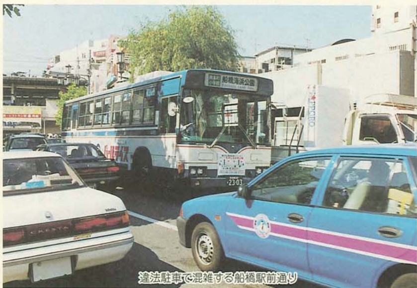
違法駐車で混雑する船橋駅前通り

違法駐車は路線バスの運行を遅らせたり、緊急自動車の通行を妨害するなど市民生活に大きな影響を及ぼしています。この条例は、市民の皆さんや事業者、市