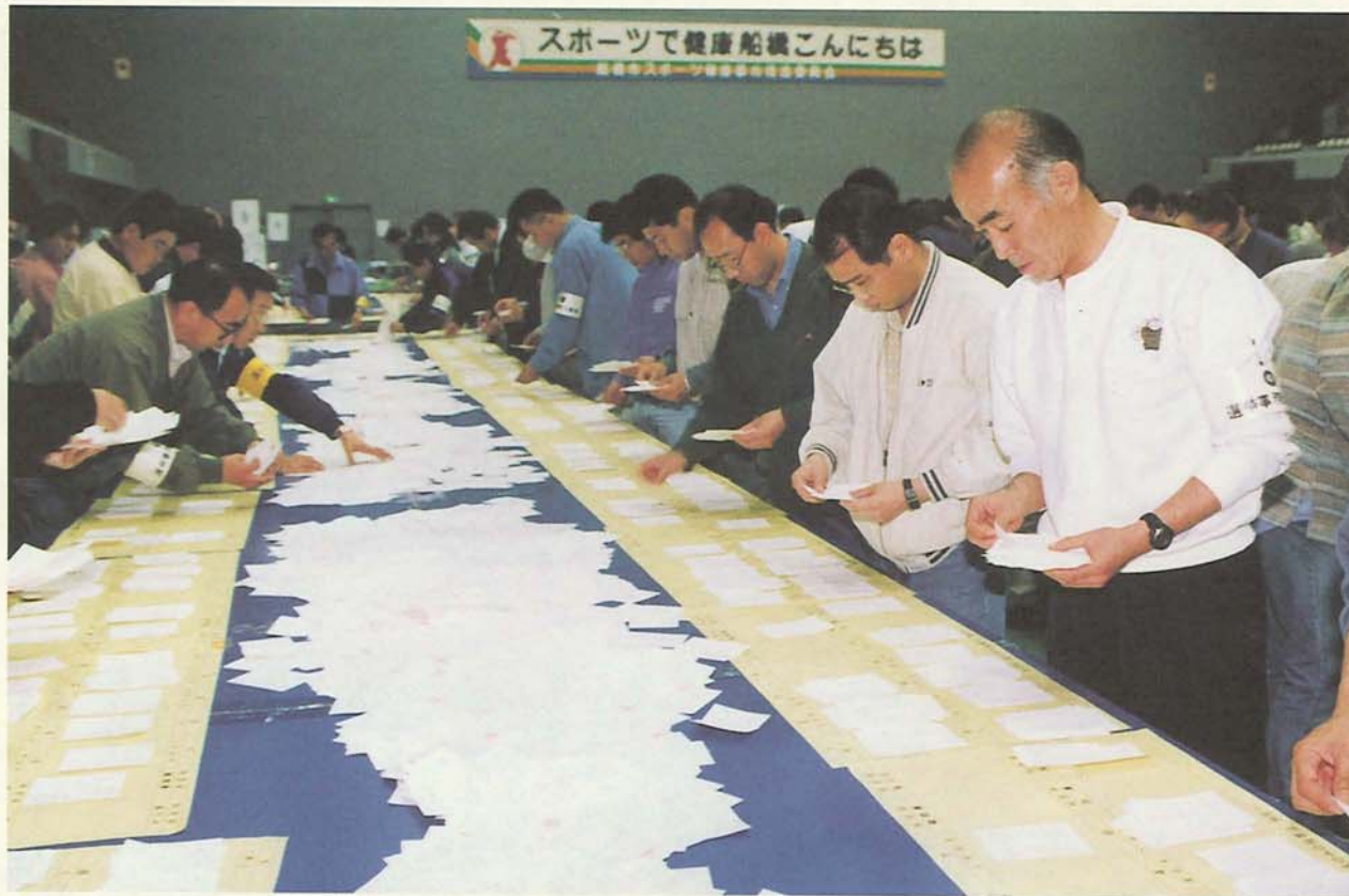
市内83か所で投票が行われ、運動公園体育館で即日開票されました