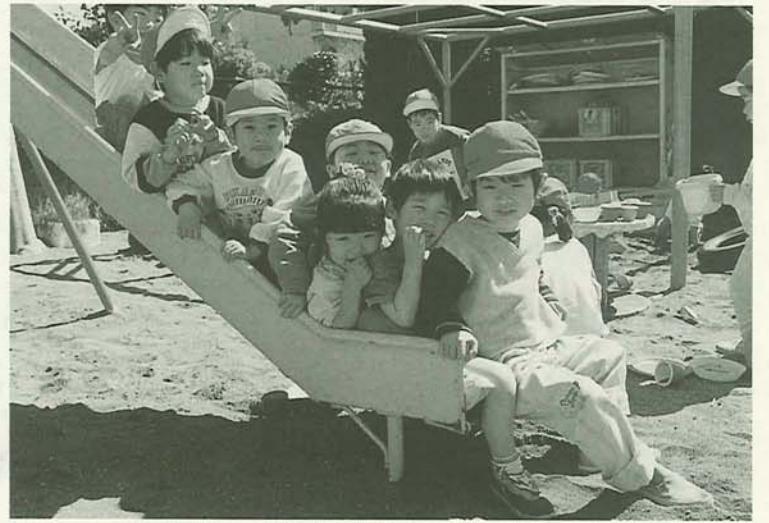
みんなすべり台が大好き(夏見第二保育園で)