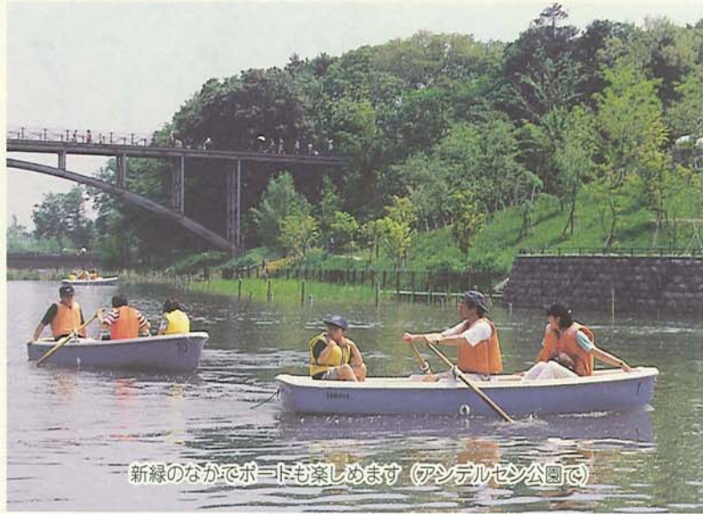
新緑のなかでボートも楽しめます(アンデルセン公園で)