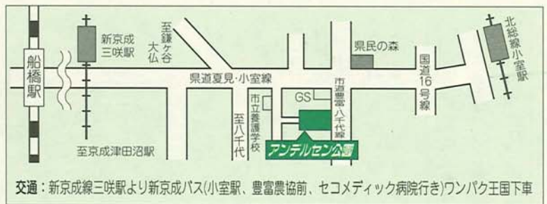
交通: 新京成線三咲駅より新成バス(小室駅、豊富農協前、セコメディック病院行き)ワンパク王国下車

利用案内 開園時間 午前9時30分〜午後4時(祝)は午後5時まで (休園日) 5月6日(木)、7日(金)、10日(毎週) 入園料 ①4歳以上100円 ②小学生210円 ③高校生610円(学生証提示) ④一般920円 ※25人以上の団体は1割引。65歳以上、身体障害者などは無料 前売り料金 ①90円 ②180円 ③550円(学生証提示) ④820円 前売り発売窓口 ○JR東日本ゆみとの窓口、びゅうプラザ○新京成電鉄○新津田沼、北習志野、五香、八柱の各駅、トラベルソイ