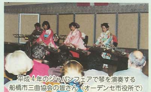
平成4年のジャパンフェアで琴を演奏する船橋市三曲協会の皆さん(オーデンセ市役所で)