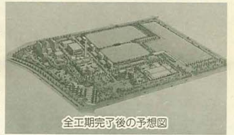
全工期完了後の予想図

多目的広場を設置 市民の憩いの場に 高瀬下水処理場では、処理した水を、トイレ用水に使用したり、処理水の温度差から生じる熱エネルギーを空調(冷暖房)として再利用します。