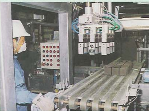
焼却灰に水を加えて、プレス成形機でブロック状に

ごみ焼却灰再資源化施設は、灰処理棟と管理棟からなり、建築面積は1854・15平方メートル、建設費は18億3750万円。この施設では、焼却灰を利用して年間約43000トンの骨材を製造します。4000トンが道路の路盤材に、残り300トンが15万個の透水性ブロックに生まれ変わります。