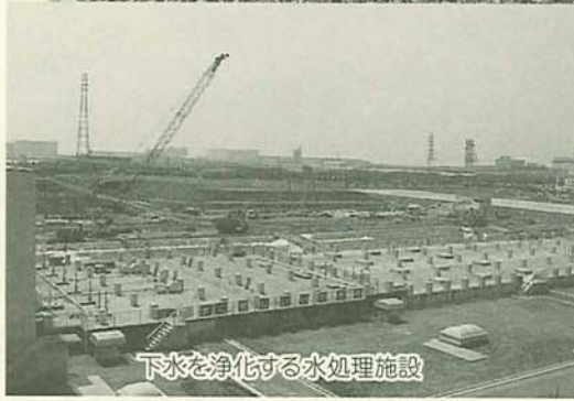
下水を浄化する水処理施設

45パーセントを占め、海老川流域からJR津田沼駅周辺を囲む3135ヘクタールに至る市内最大の処理区です。高瀬下水処理場の第1期分は、工事費が198億円。建物は、管理本館、沈砂池ポンプ棟、汚泥処理棟、水処理施設(全体の8分の1が完成)からなり、汚水の処理方法は、下水中の汚物を微生物の働きによって処理する標準活性汚泥法を採用しています。