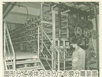
図形分と液体分に分ける膜分離装置

増加していることから、平成8年から建設を進めてきたものです。1日の処理能力は180キロリットル