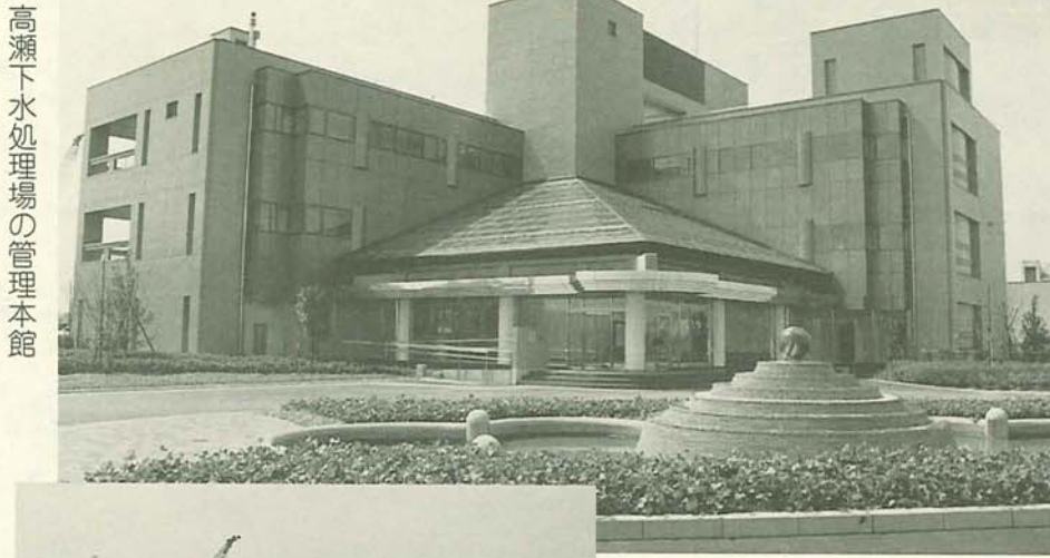
高瀬下水処理場の管理本館

高瀬処理区内の一部地域で供用を開始 市の中央部に位置する高瀬処理区は、下水道計画区域の