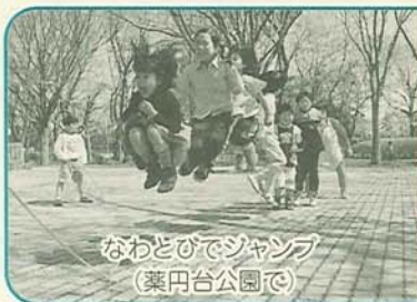
なわとびでジャンプ (薬田公園で)