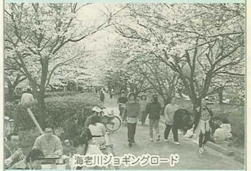
海老川ジョギングロード