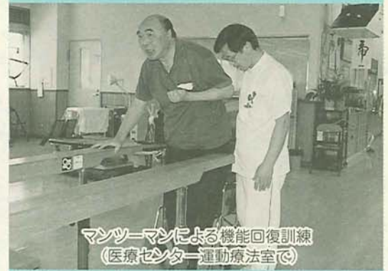
マンツーマンによる機能回復訓練 (医療センター運動療法室で)

問合せ 健康指導課 ☎436-2415 保健指導課 ☎436-2382 (〒273-8501 湊町2-10-25)