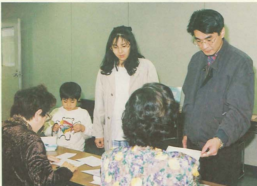
棄権せず不在者投票を(市役所で)