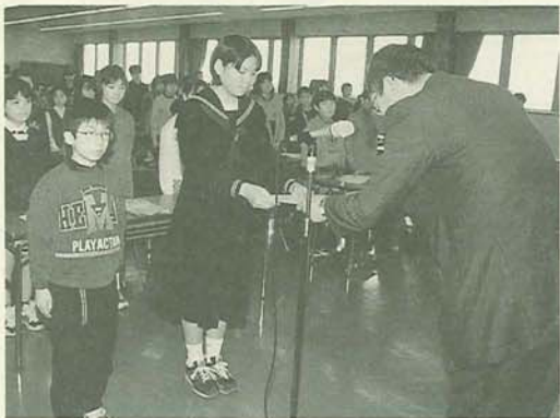
「がんばってください」と市長から委嘱状が手渡されました

4月1日、市役所で平成11年度児童・生徒記者委嘱状伝達式が行われました。広報ふなばしの「子ども記者通信」で、学校での出来事や身近なまわりの話題などを紹介してくれる児童・生徒記者。今年も「特ダネ」にご期待ください。