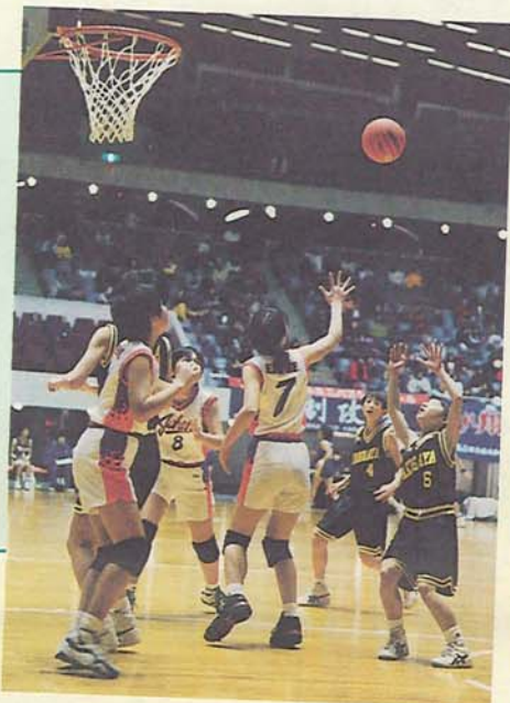
対城辺ミニバスケットボールクラブ (代々木体育館で)

八木が谷 小学校ミニバス ケットボールク ラブの女子チームが、千葉県代表 として全国大会に初出場。3月28 日、29日に行われた予選を突破し、 決勝リーグへ進出しました。30日 に、愛媛県の代表チームと対戦し ましたが、惜しくも敗れ3位にな りました。選手の懸命なプレーに、 応援席から暖かい拍手が送られま した。