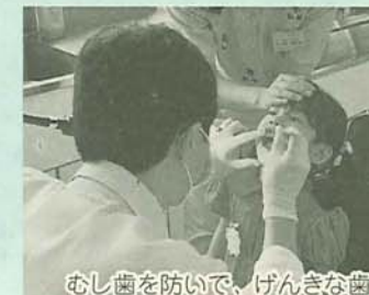
むし歯を防いで、げんきな歯