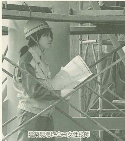
建築現場に立つ女性技師