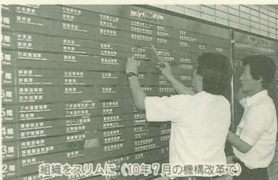
組織をスリムに、(10年7月の機構改革で)