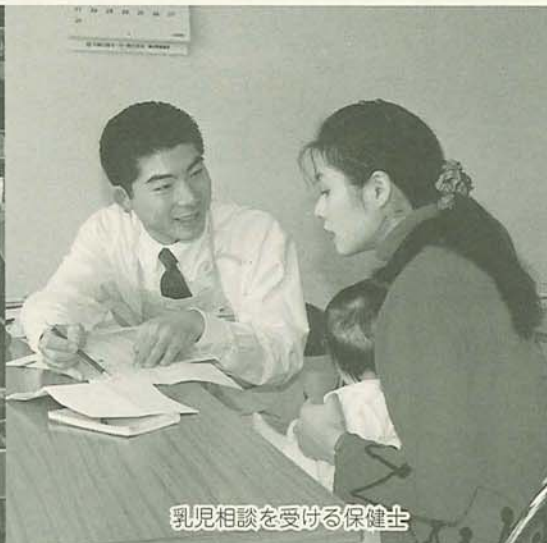
乳児相談を受ける保健士