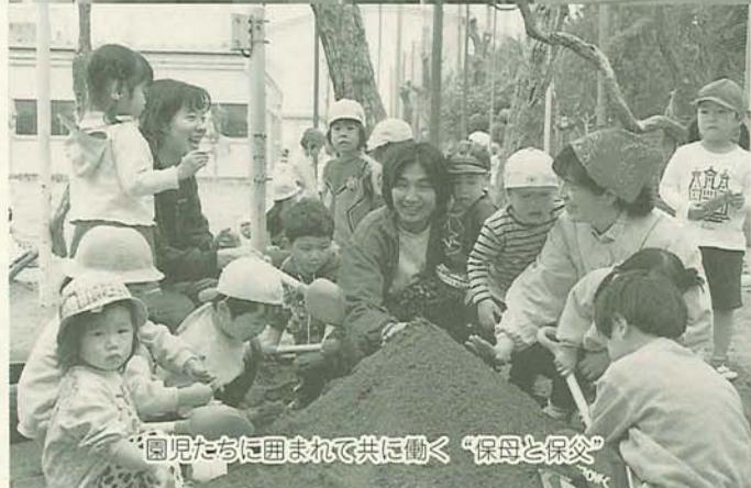
園児たちと囲まれて共に働く「保母と保父」

男女雇用機会均等法が改正され、4月1日から施行されます。今回の改正により、「男の仕事」「女の仕事」といった男女間の仕事の境界がなくなり、個人の意欲や能力を十分に生かせる職場環境づくりが進んでいきます。この法律の主な改正点についてお知らせします。