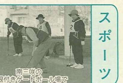
南三咲の屋根付きコートボール場で

水泳競技は5月23日(日) 会場 県総合運動場(水泳は県立四街道養護学校) 対象 13歳以上の知的障害者(参加標準記録あり) 種目 陸上・水泳・フライングディスク 申込み 4月9日(金)までに障害福祉課 ☎436・2357へ