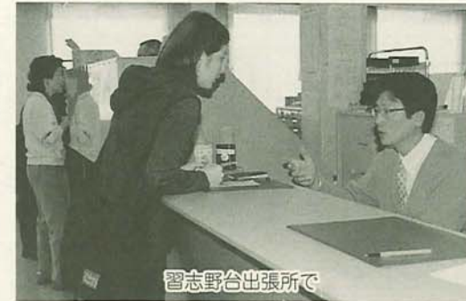
習志野台出張所で

○交通・火災等災害共済の加入・更新・変更などの手続き ○軽自動車税、市民税、固定資産税の証明書の交付 ○原動機付自転車(125cc以下)などの新規登録・廃車などの新規登録・廃車