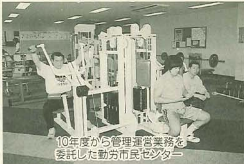
10年度から管理運営業務を委託した勤労市民センター

実態を踏まえたうえで、行政手続を適宜見直しする。 (2) 公文書公開制度のより一層の充実を図る。また、外部団体の情報公開についても検討する。