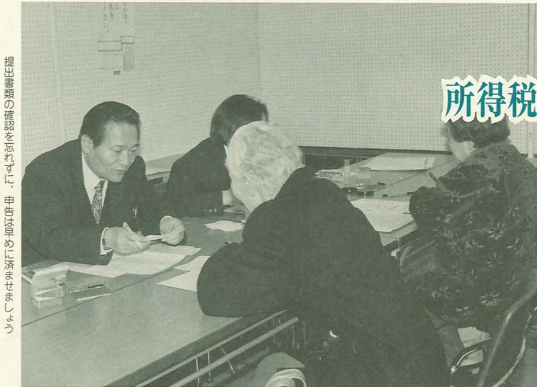
提出書類の確認を促され、申告を早めに行うよう促されています。

所得税、市・県民税、国民健康保険料の申告が始まります。申告の受付と指導・相談は2月16日(火)から3月15日(月)までです。なお、土曜日と日曜日は、税務署・市役所とも休みとなるため、申告の受付は行いませんので、ご注意ください。3月に入ると大変混み合いますので、早めに申告を済ませましょう。