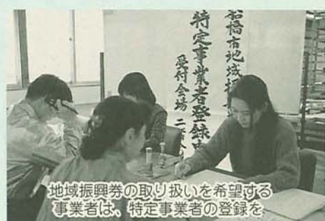
地域振興券の取り扱いを希望する事業者は、特定事業者の登録を