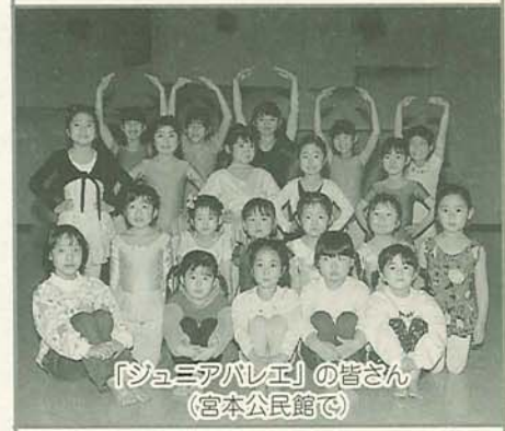
「ジュニアバレエ」の皆さん (宮本公民館で)