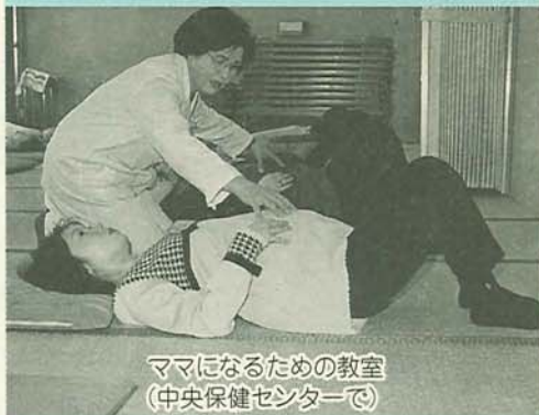
ママになるための教室 (中央保健センターで)

健康指導課 ☎436-2415 保健指導課 ☎436-2382 問合せ (〒273-8501 湊町2-10-25)