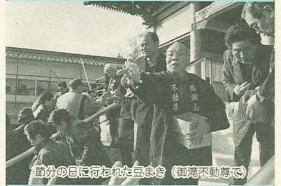
節分の目に行われた豆まき(御滝不動尊で)