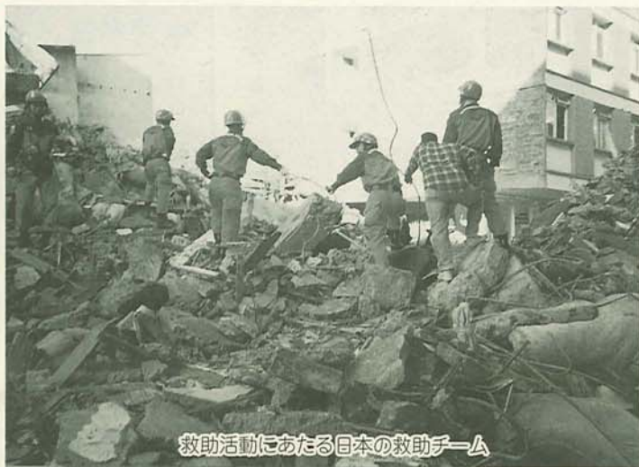
救助活動にあたる日本の救助チーム