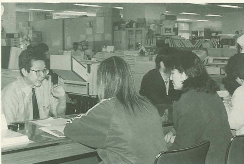
学生の免除制度もありますのでご利用ください

国民年金などの公的年金は、老後や現役世代が病気や事故で体が不自由になった場合の生活を支える大切なものです。また、「世代と世代の支え合い」と言われるように現役世代が高齢者の世代を支え、現役世代が高齢者になった時は、その次の世代が支えていく制度です。将来に備えるためにも、加入の手続きを忘れずにしましょう。