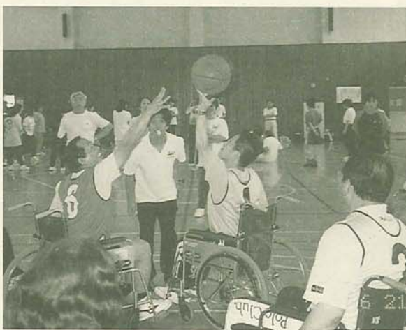
車いすバスケットボールを体験する第13期生 (青少年会館で)