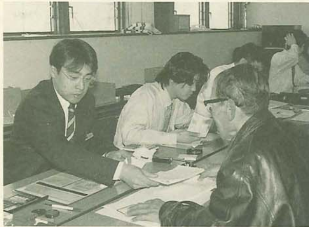
マイホームをローンで取得した、多額の医療費を支払ったなどの還付申告は、確定申告期間前でも船橋税務署で受け付けています