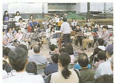
り広場で開かれた〇〇〇〇〇コンサート。(写真C)