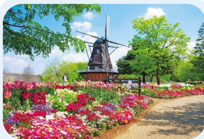
“行ってみたい”魅力の創生