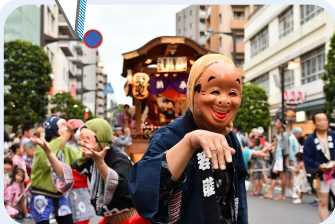
文化・スポーツ振興