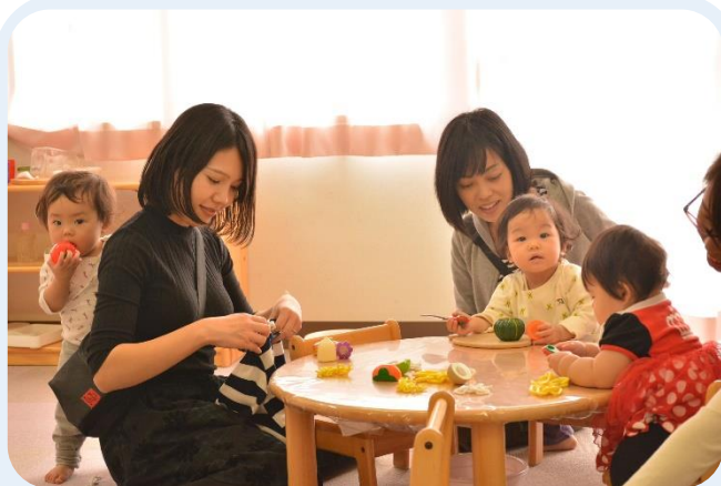
子ども・子育て応援