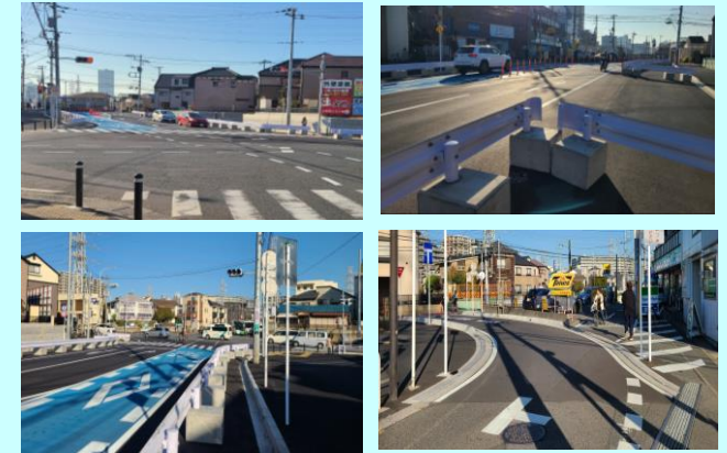
街路事業(3・3・7号線)