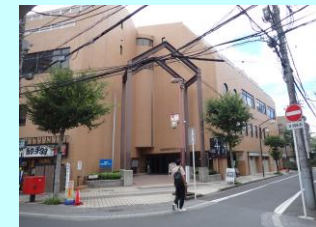
既存建築物活用事業(勤労市民センターバリアフリー化等)