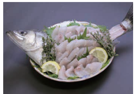
江戸前の高級魚スズキ