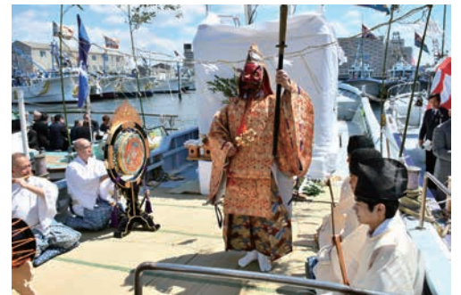
江戸時代から続いている「水神祭」