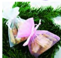
▲ウッドチップのサシェ