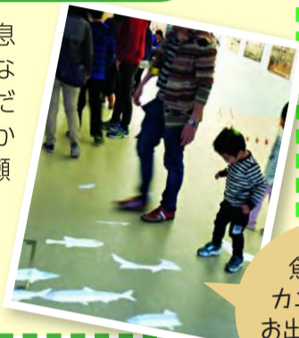
魚や鳥、カニなどがお出迎えしてくれるよ

三番瀬の面積や生息する生きもの数など三番瀬にちなんだ数字や、江戸時代から現在までの三番瀬の様子を紹介。まずは三番瀬がどんなところなのか知ろう。