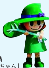
小松菜の妖精「西船なな姫ちゃん」