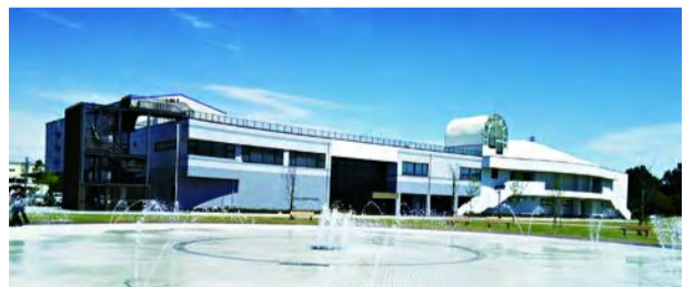
▲環境学習館と噴水広場