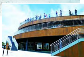
▲2階建ての展望デッキ

所在地 〒273-0016 潮見町40番 開館時間 午前9時～午後5時※7月1日(土)は午前10時～ 休館日 毎週(月) (祝・休)と重なった場合は次の平日)、12月29日～1月3日