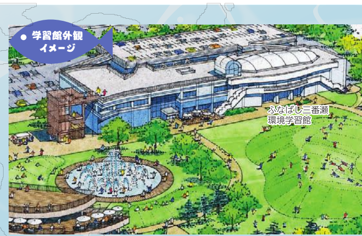
● 学習館外観イメージ