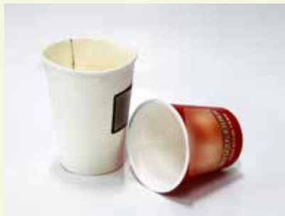
防水加工紙 (紙容器など)