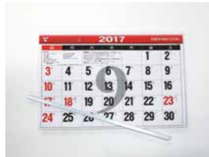
カレンダー (金具などは除く)