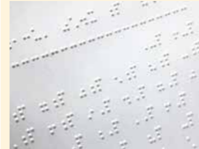
感熱性発泡紙 (点字印刷など)

× 特殊加工されたもの(混入すると、再生紙に凹凸が出たり、印刷不良を起こします)