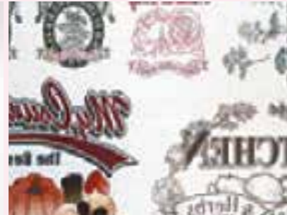
昇華転写紙 (アイロンプリントなど)