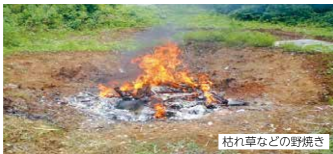
枯れ草などの野焼き

不法投棄や野焼きは法律で禁止されており、罰則として 5 年以下の懲役若しくは 1,000 万円以下の罰金 (法人は 3 億円以下) が定められています。船橋市では廃棄物の適正な処理を推進するため、土日夜間を含め、パトロールなどの監視活動に取り組んでいます。