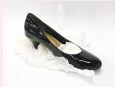
靴や靴などの詰物 (捺染紙)