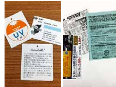
タグや名刺 チラシや印刷物