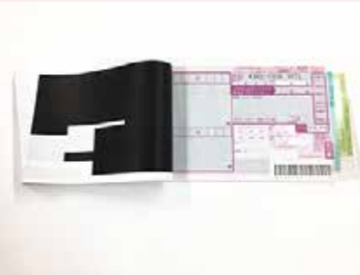
カーボン紙 (伝票など)

× 特殊加工されたもの(混入すると、再生紙に凹凸が出たり、印刷不良を起こします)