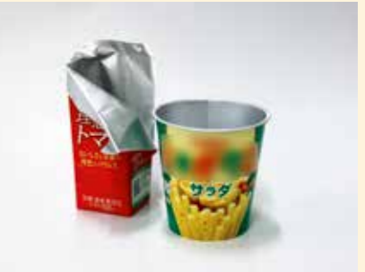
アルミコーティング紙