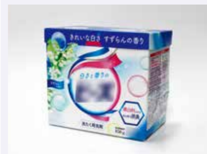
洗剤や線香の箱など

× 汚れや臭いのついたもの(処理工程で臭いや汚れを除けず衛生上などの問題があります)