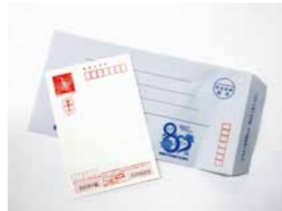
封筒・はがき (氏名、住所黒塗り)