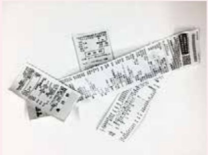
感熱紙 (レシートなど)