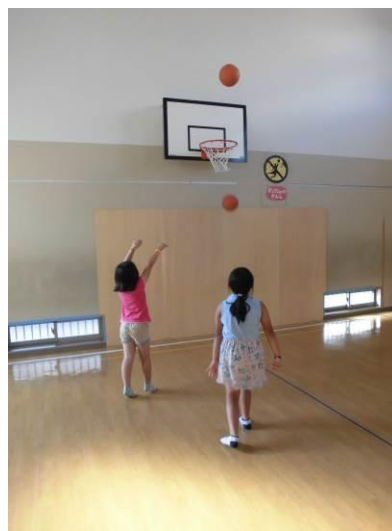
フリースロー対決!