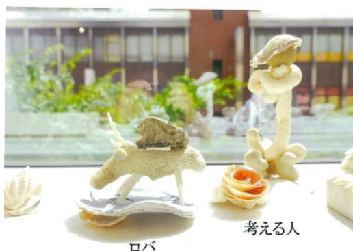
【漂白した貝殻で作りました】

第4回みんなの三番瀬写真展の案内状、チラシ、ポスター作成費用 貝殻工作の備品代(ビーズ、テグス、ボンド、ハサミなどの購入)一式