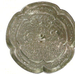
瑞花双鳳五花鏡（復元模造品）