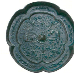
瑞花双鳳五花鏡（原品）