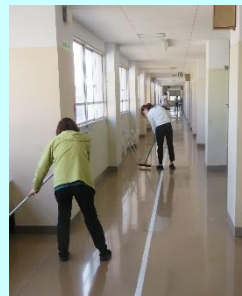
毎日の業務は清掃からスタートしました