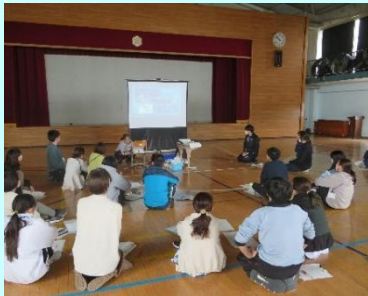
命を守るための食物アレルギー研修