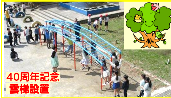
40周年記念 雲梯設置

4月23日（火）に「1年生を迎える会」を行いました。各学年からの呼びかけや〇×クイズなどがあり、とても楽しい会になりました。 高学年の児童会・代表委員の皆さんは、初めての大きな行事でしたが、みんなが笑顔になれる心温まる会を運営してくれました。ありがとうございました。