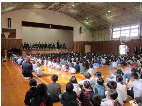
着任された先生方のあいさつ

しぎょうしき 始業式では、私から、「 じりつ めざ 自立を めざ 目指そう」という話をしました。「自立」とは、 じぶん 自分 かんが で考へて、 き 自分で決めて、 こうどう 自分で行動していくことです。 おとな 大人になった時、とても大切なことです。 しょうがくせい 小学生のうちに、少しでも自立することに近づけるように がんば 頑張ってほしいと思います。その一つとして「あいさつ」が自分からできるようになるといいですね。また、「ことば」を大切に こま して、困っている人がいたら、 やさ 優しく声をかけられるようになれるといいですね。また、4月に入学してくる1年生に、 やさ 優しくいろいろなことを おし 教えてあげてくださいね。