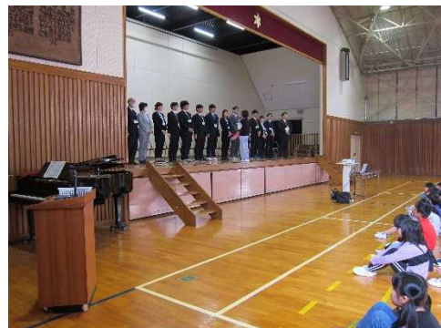
代表児童の迎えることば